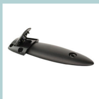
Фурнитура для соединения столешницы