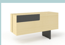
Стационарная тумба справа