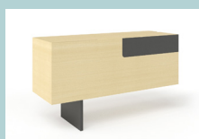
Стационарная тумба слева